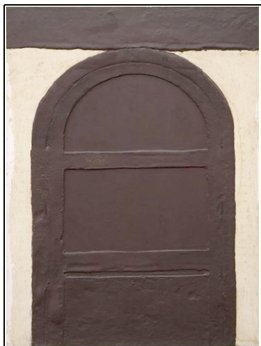
Abb. 2. Porta marró , 1963, 195–130, verschiedene Materialien auf Leinwand, Stedelijk Museum, Amsterdam.

Grund in all ihren Kreuzen, Furchen, Rillen, Schriftzügen, Strichen und Eingängen an ihnen haften. Dabei gibt es keinen Unterschied zwischen Träger und Oberfläche, zwischen Stein und Furche, Zeichenkörper und Zeichen. Wenn er bei seinen Radierungen etwa Löcher in die Kupferplatten einfügt, die sich beim Drucken auf das Bild übertragen, ist dies, laut Tàpies, keine Imitation: Es gäbe keinen Unterschied zwischen einem Loch und dem Bild von einem Loch. 19 Muss man dann nicht annehmen, dass Tàpies' ganzes brachiales Werk folglich aus nichts als Löchern besteht?